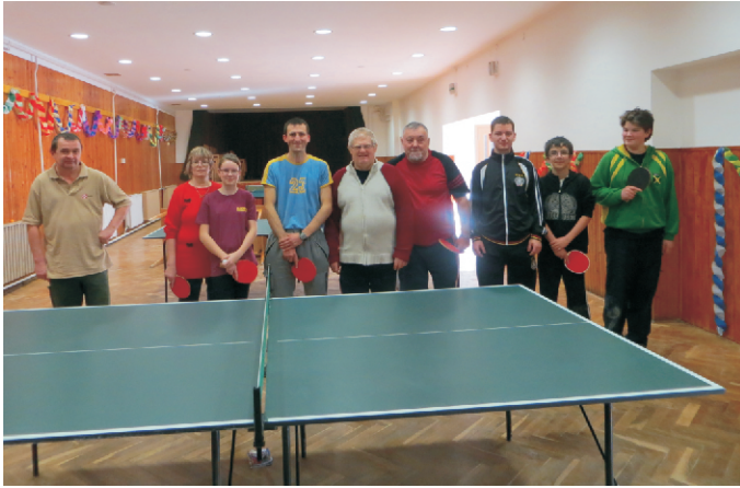
A pingpongverseney résztvevői