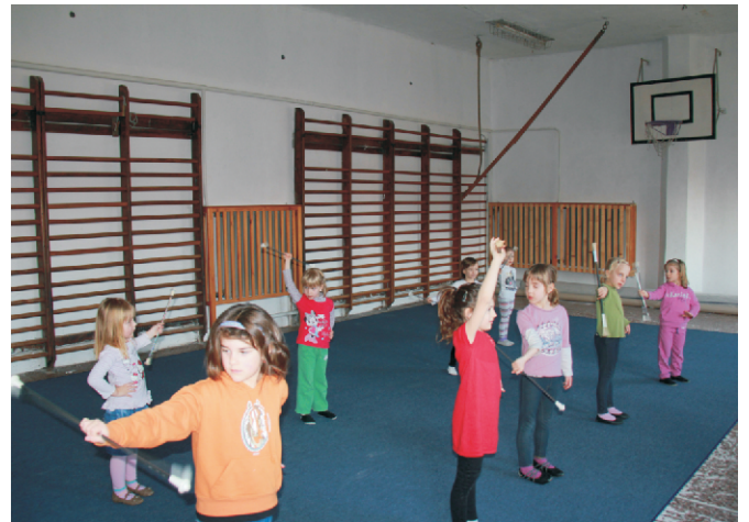
Twirling próba az új szőnyegen