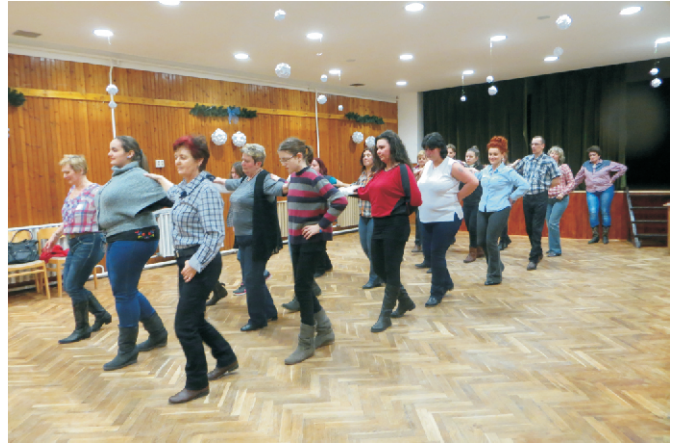
3. születésnapját ünnepelte a country csoport