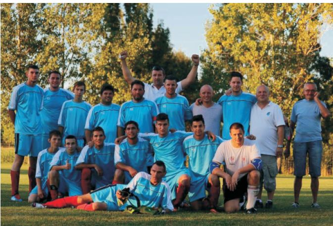
A dicsőséges focicsapat