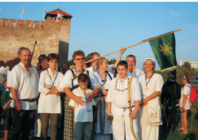
A kiválóan szereplő íjászcsoport Gyulán Biztos kezekben a jövő