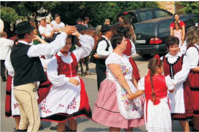
Szüreti multság I.