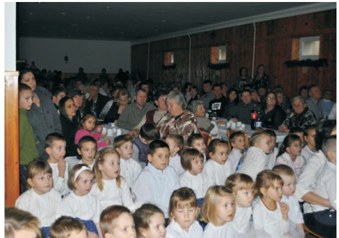
A Falukarácsony idősebb és fiatal nézői Kórustalálkozó