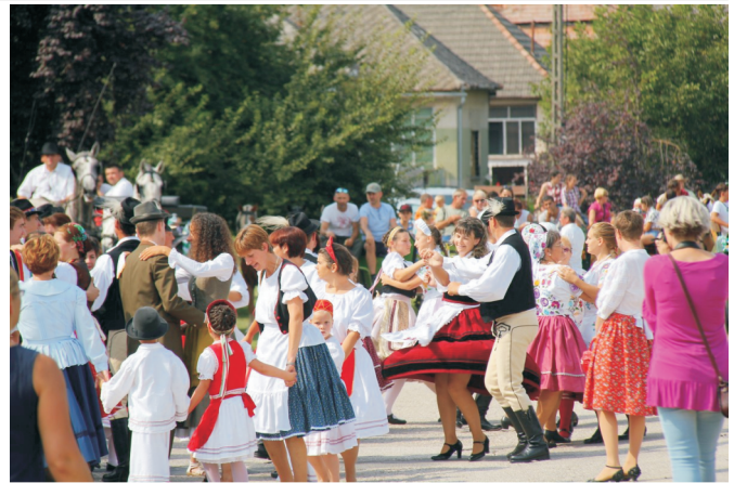
Szüreti multság II.