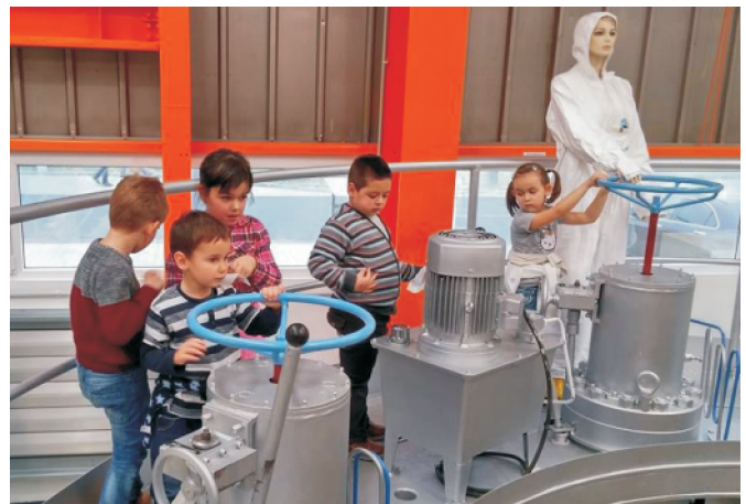
Ovisok az Atomerőmű múzeumában